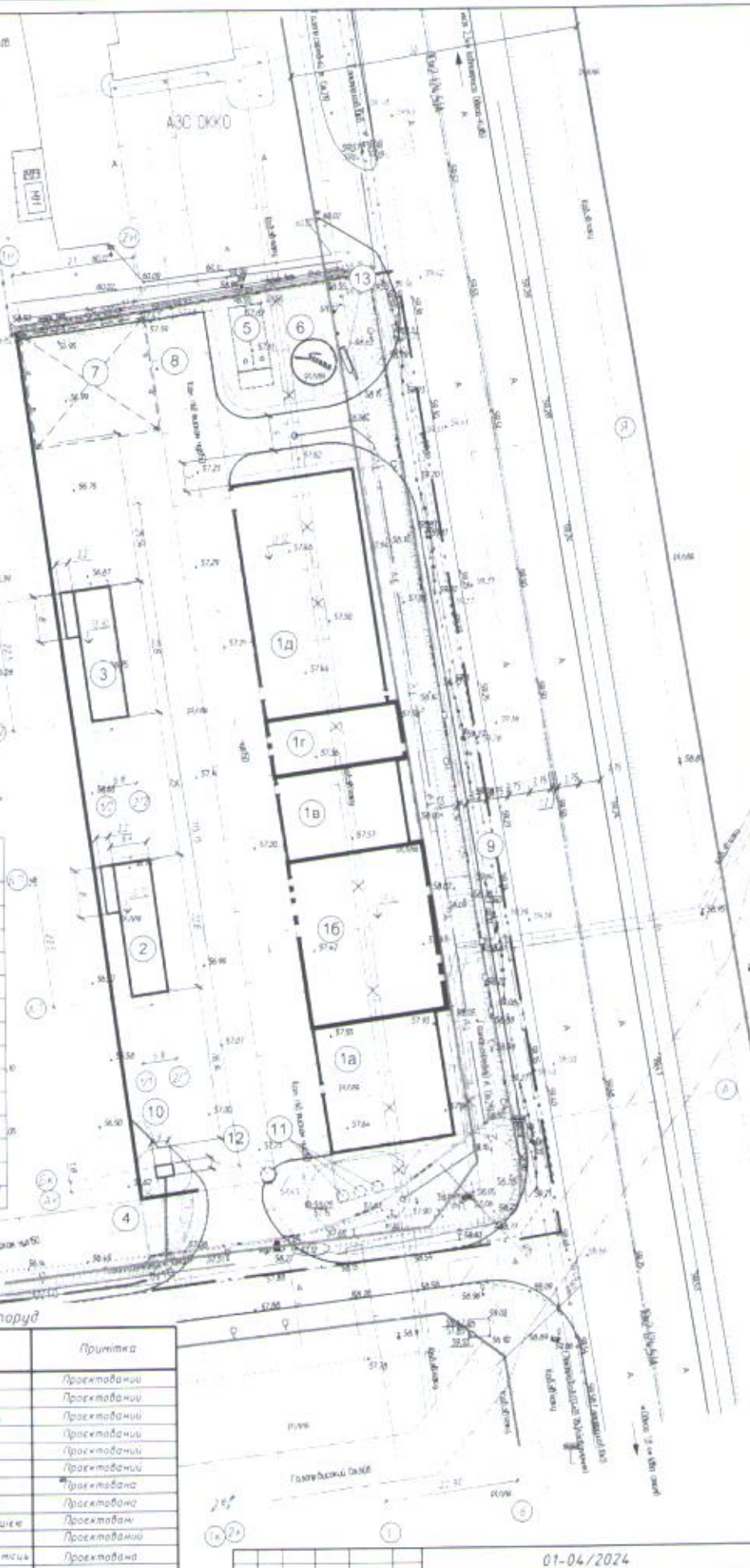
Умовні графічні позначення